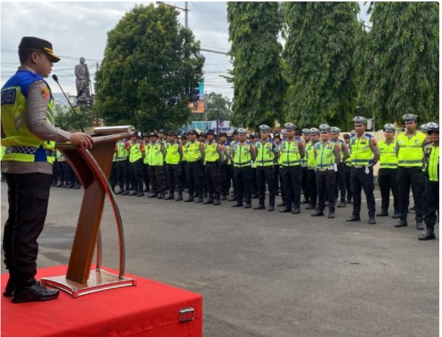
Kapolres Purbalingga, AKBP Achmad Akbar Kukuhkan Pleton Siaga Bhayangkara

Purbalingga – Polres Purbalingga, Polda Jawa Tengah, mengukuhkan Pleton Siaga Bhayangkara sebagai langkah kesiapsiagaan dalam menghadapi potensi bencana alam yang dapat terjadi di wilayah Kabupaten Purbalingga.